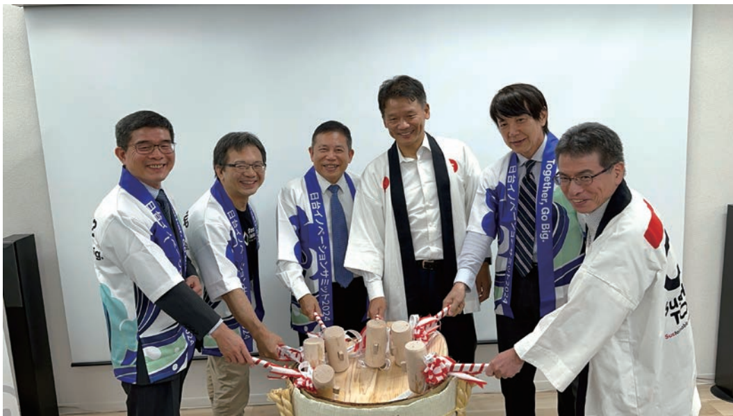
東京新創基地鏡開儀式合照

間搭建更堅實的橋梁，提供臺日企業、新創及投資機構等雙向常態性協助，讓新創更容易走向彼此的市場，成為全球最亮眼的新星。