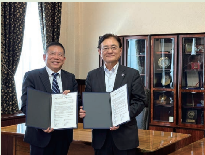
國發會劉主委鏡清（左）與京都大學湊長博（右）校長合影

全球 Bridge 計畫的第一個合作對象是日本京都大學，在劉主委鏡清及京都大學校長湊長博的見證下，國發基金與京都大學創新資本 (iCAP) 於 9 月 13 日正式簽署合作備忘錄 (MOU)，這是國發基金首次與國外知名大學合作規劃設立創投基金，希望透過臺日雙方相互投資，進一步強化臺日新創與企業的交流合作，尤其將強化在深科技 (Deep Tech) 領域培育更多優質團隊，如半導體、機器人、淨零、材料與量子科技等，建立雙邊長期雙贏的交流管道，強化日本和臺灣新創生態系的夥伴關係。